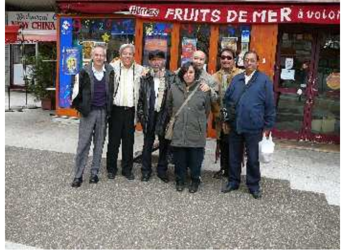
Dernière photo de Café Catinat (devenu Café Lily en mai 2008)