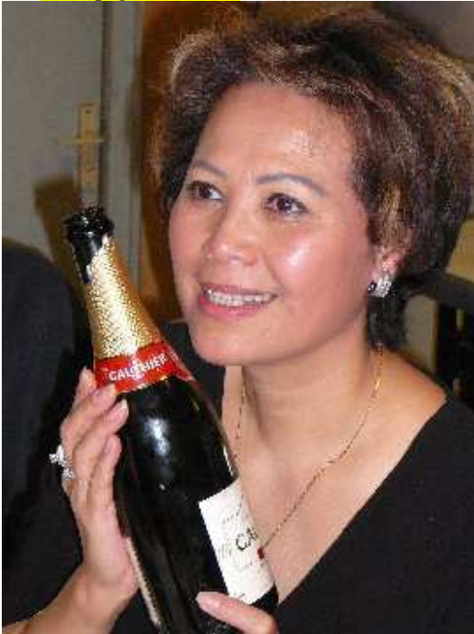
Champagne Gauthier et Red_Spring