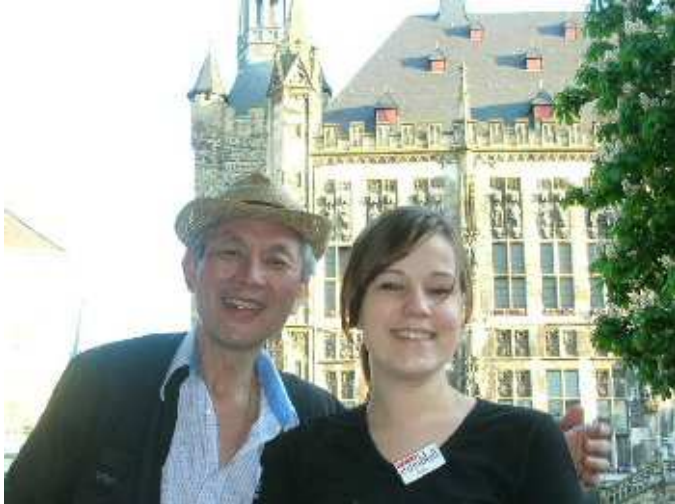
La dernière rencontre de délégué_65 à Aix-la-Chapelle