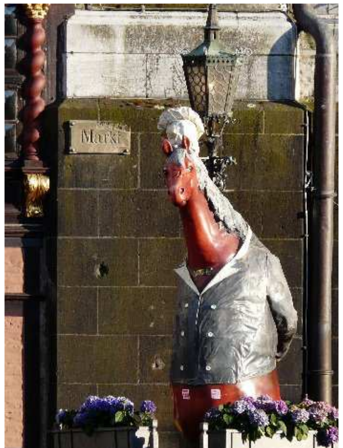
Place du Marché – Aix-la-Chapelle