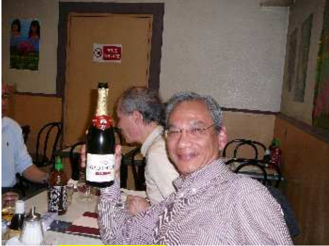
Champagne Gauthier et Golden_Mountain