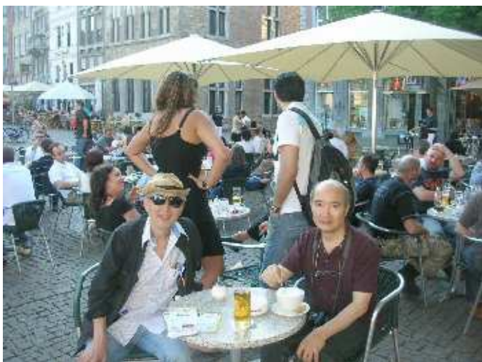
Place du Marché – Aix-la-Chapelle

Date : 16-mai-2008 Lieu : Paris – France : Impérial Choisy & café Lily Qui : Scribouillard, Rose_de_HàTiên, Honnête_Belge, Guide_de_Bruges