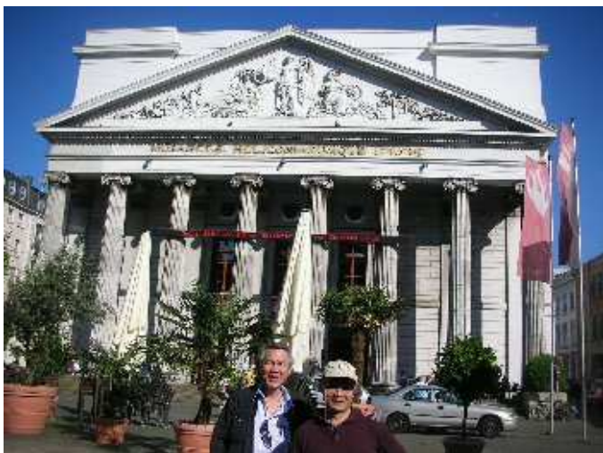
Theater Aachen – Bühne Musikalisch – Theaterplatz - Aachen