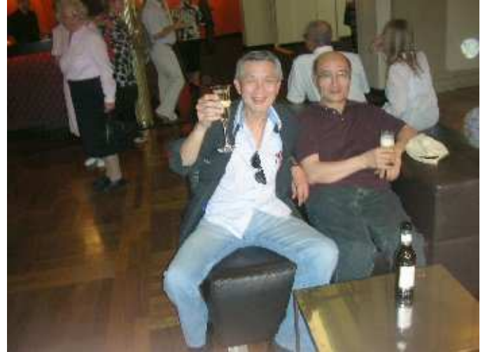
Champagne en entracte !