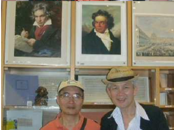
Beethoven Haus – Bonn