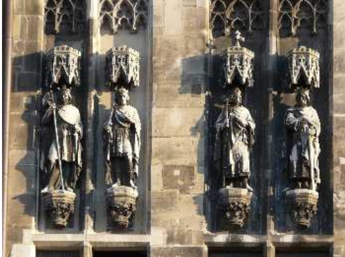
Hotel de Ville – Aix-la-Chapelle