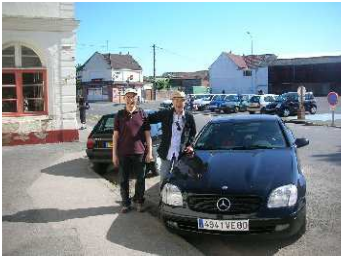
Saint-Just-en-Chaussée – Oise