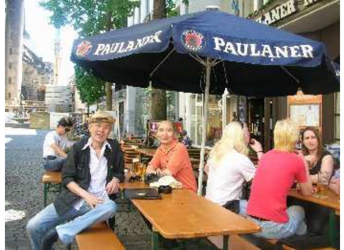
Martinsplatz - Bonn