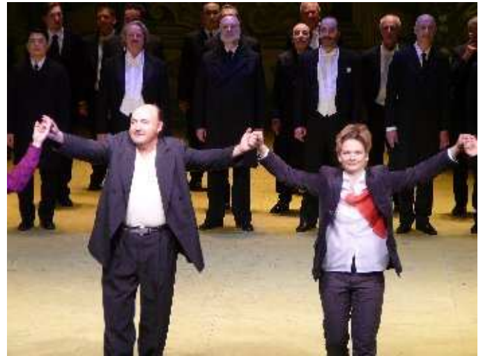
Rigoletto et Gilda