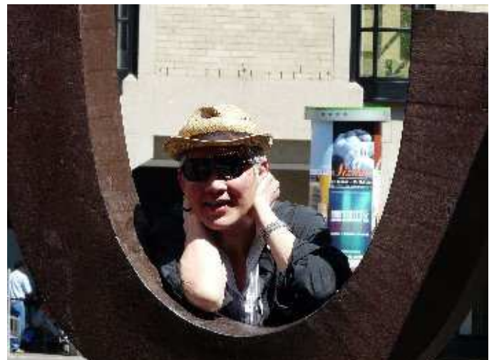
Münsterplatz – Bonn